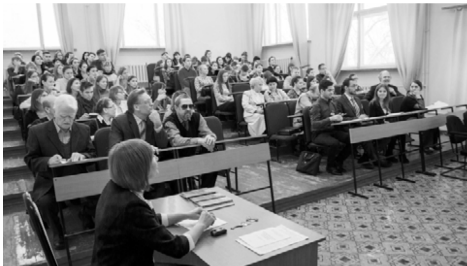
Тесная дружеская атмосфера

Конференция прошла в тесной дружеской атмосфере.