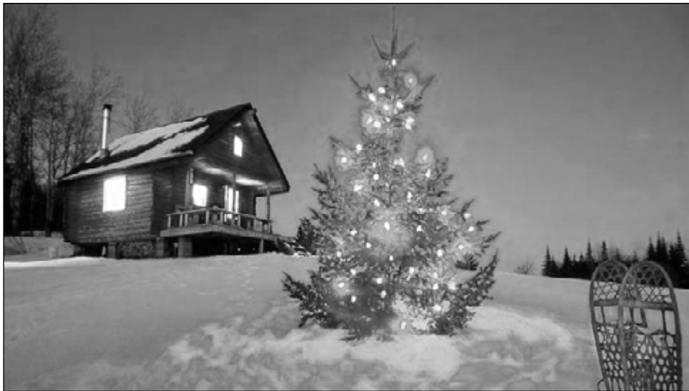
Новый год в деревеньке

– Вырезаем из бумаги снежинки, затем сами наклеиваем на окна, чтобы атмосфера в доме стала ещё более празд-