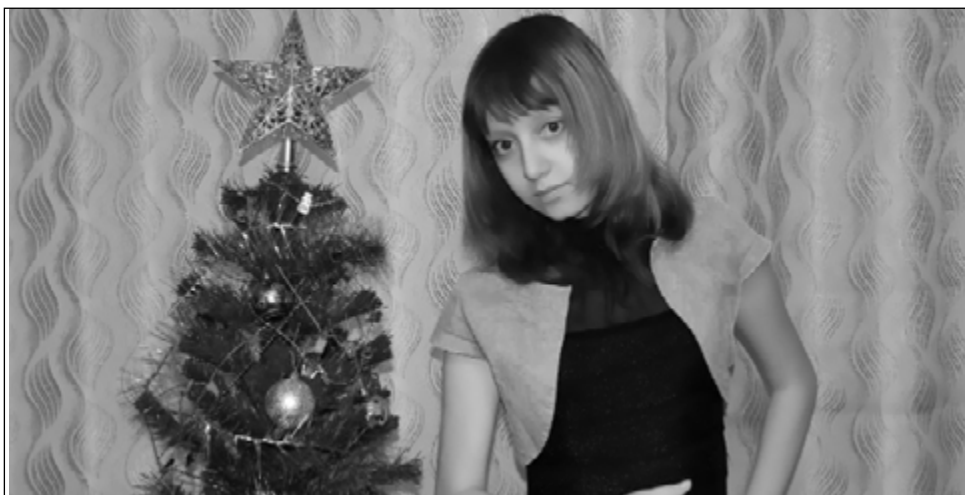
Наряжаем елку всей семьей

Говорят, как встретишь новый год, так его и проведешь: празднуйте с легкой душой и сердцем, оставляйте все обиды в уходящем году, встречая Новый год с положительным настроением и свежими силами!